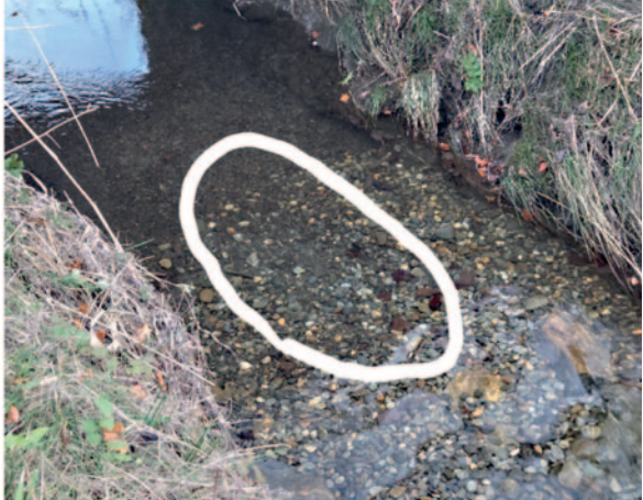
Abbildung 1: Laichgrube im frisch geschütteten Kies im Hausenbach.

eine Präsentation mit zusätzlichen Grafiken und Einblicken, mit besonderem Augenmerk auf das Gadmerwasser.